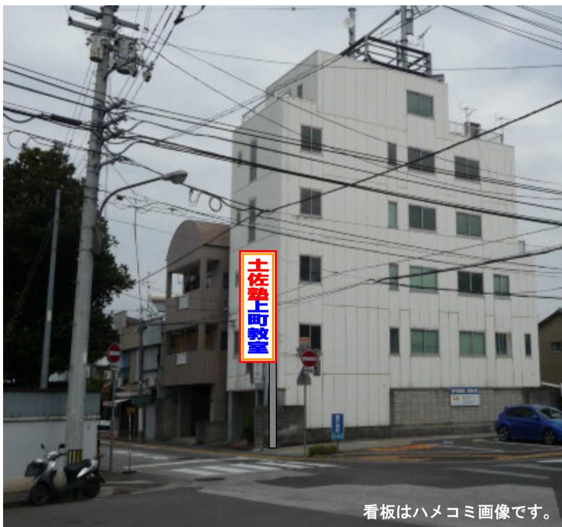
看板はハメコミ画像です。